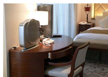
ホテルお客様をはじめ、業務用としても多数ご利用いただいております。

また、フィルターの交換がファンの交換ともなる本製品機構は、「ファンの汚れによるニオイ発生」の問題を危惧するお客様のお声から生まれたデザインです。