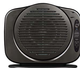
Turbulence NEW CONCEPT AIR PURIFIER TB-201ウォーターグレー

リビングはもちろん、客間、書斎などにも、ハイグレードな空気感を演出できる、こだわり家電製品として、30～50代の本物志向のユーザーをターゲットに、展開して参ります。